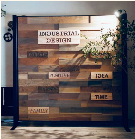
■パーティション「KUMIKI～組木～」