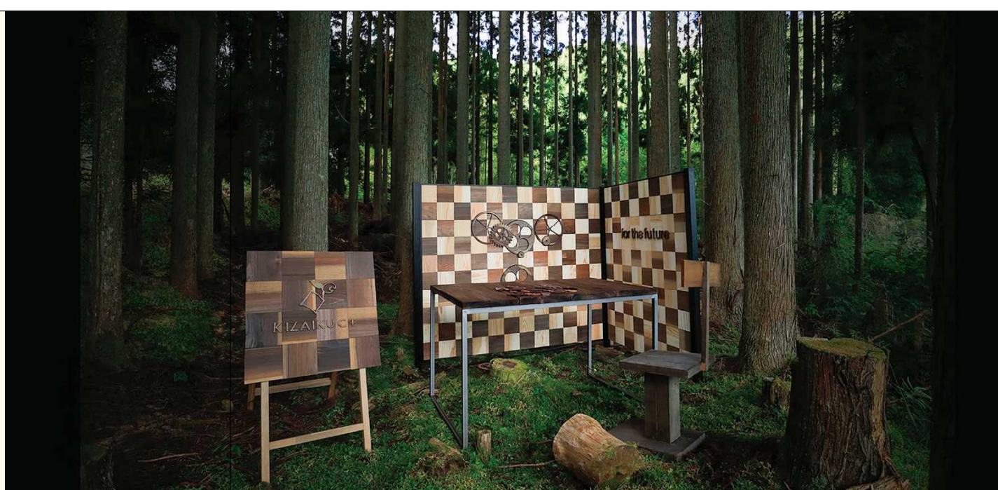
■自然素材でつくるパーテーション

その製法の一つに、鉄媒染による木の染色があります。塗装を施さず、木の色目を変化させることによって、木の表面を素地のままに保つことが可能となります。この染色に魅せられ、納得のいく色目に染色するために、さまざまな媒染液をつくっては試作を重ね、ようやく、思った色目が出せるようになりました。